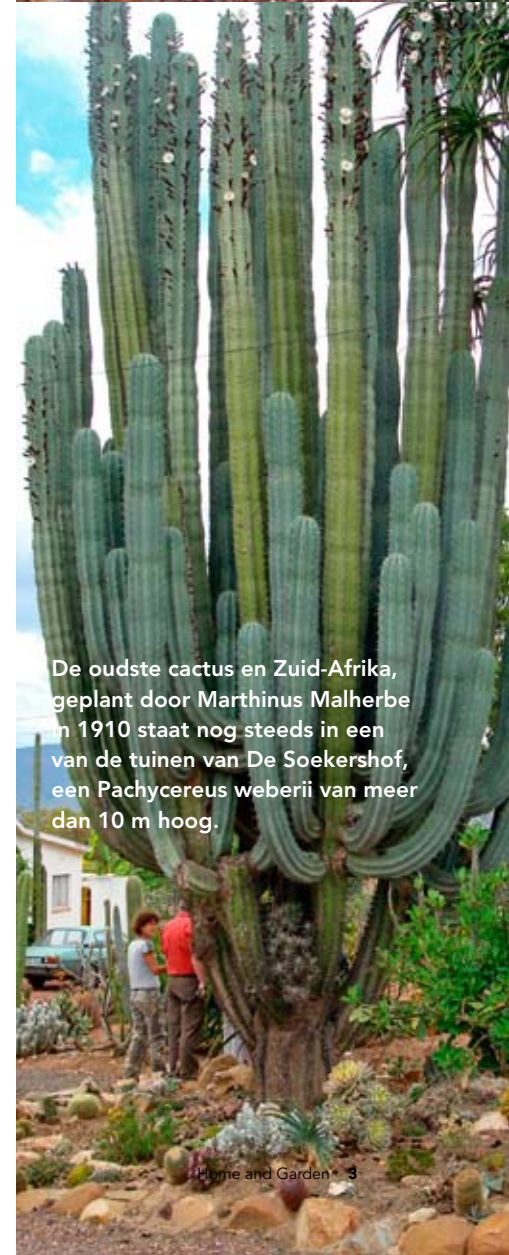
De oudste cactus en Zuid-Afrika, geplant door Marthinus Malherbe in 1910 staat nog steeds in een van de tuinen van De Soekershof, een Pachycereus weberii van meer dan 10 m hoog.