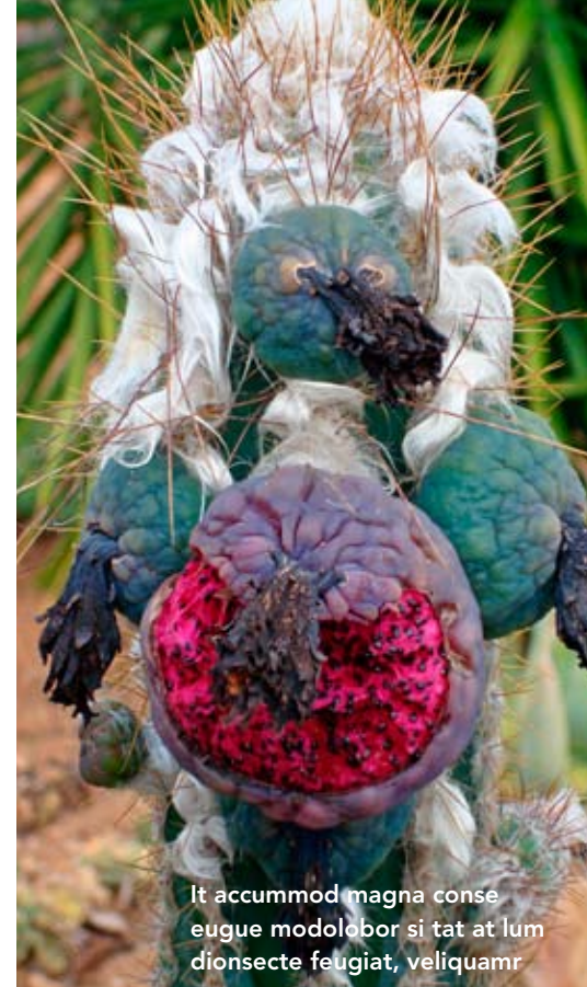
It accummod magna conse eugue modolobor si tat at lum dionsecte felgiat, veliquamr