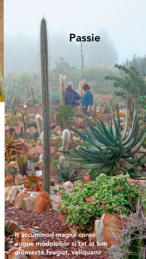
It accummod magna conse eugue modolobor si tat at lum dionsecte feugiat, veliquamr