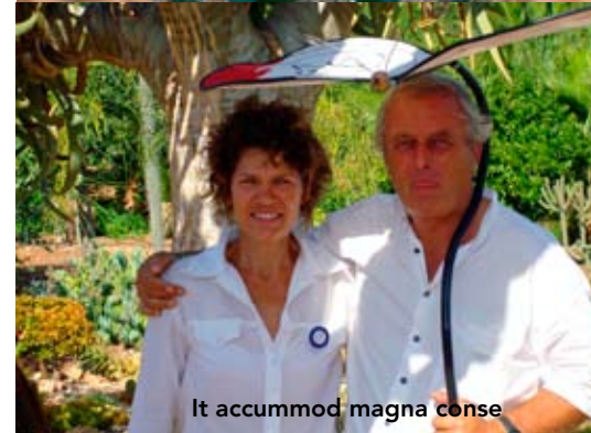
It accummod magna conse